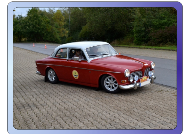
Die 3. Indeland Herbstfahrt ist ein Wertungslauf zum Euregio-Classic-Cup 2024